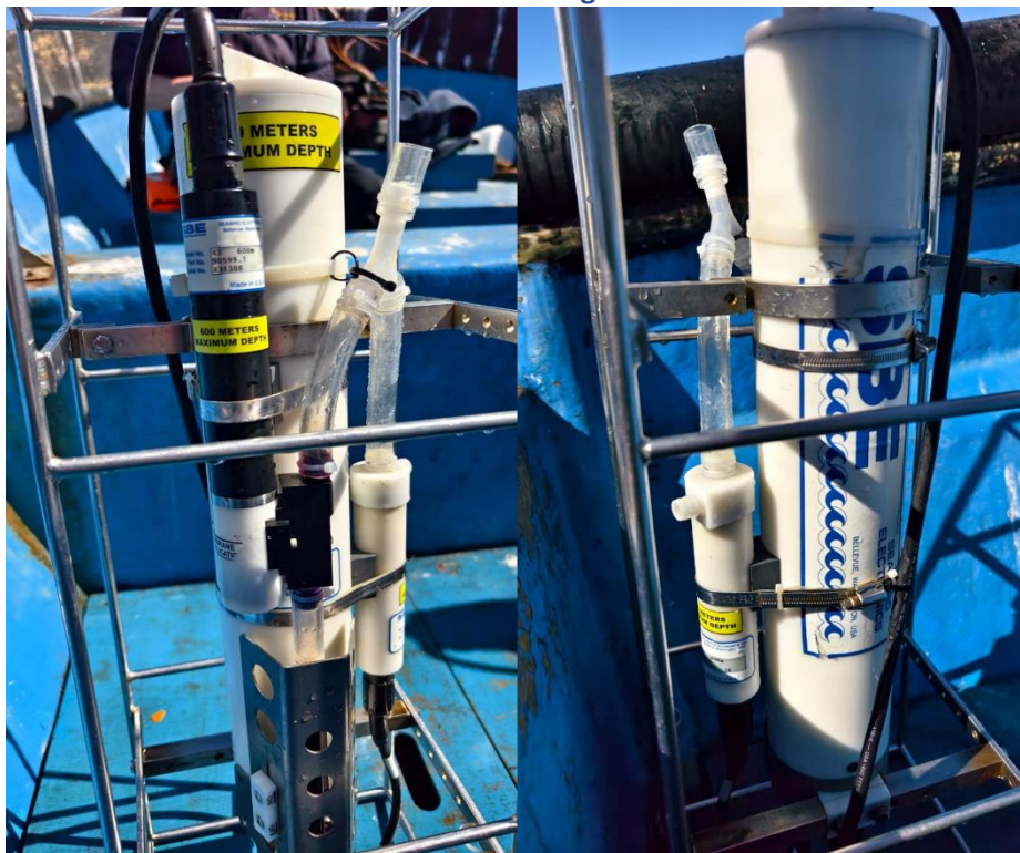
Figura 4 Equipo CTD Seabird 19 empleado para el estudio de la salinidad y temperatura en la columna de agua.

Para la Campaña Invierno 2025 se utilizó un equipo CTD Seabird 19plus V2 SeaCAT (Figura 4), reconocido por su alta precisión y resolución. La ubicación de cada estación fue registrada mediante GPS para asegurar la repetibilidad del muestreo en campañas posteriores.