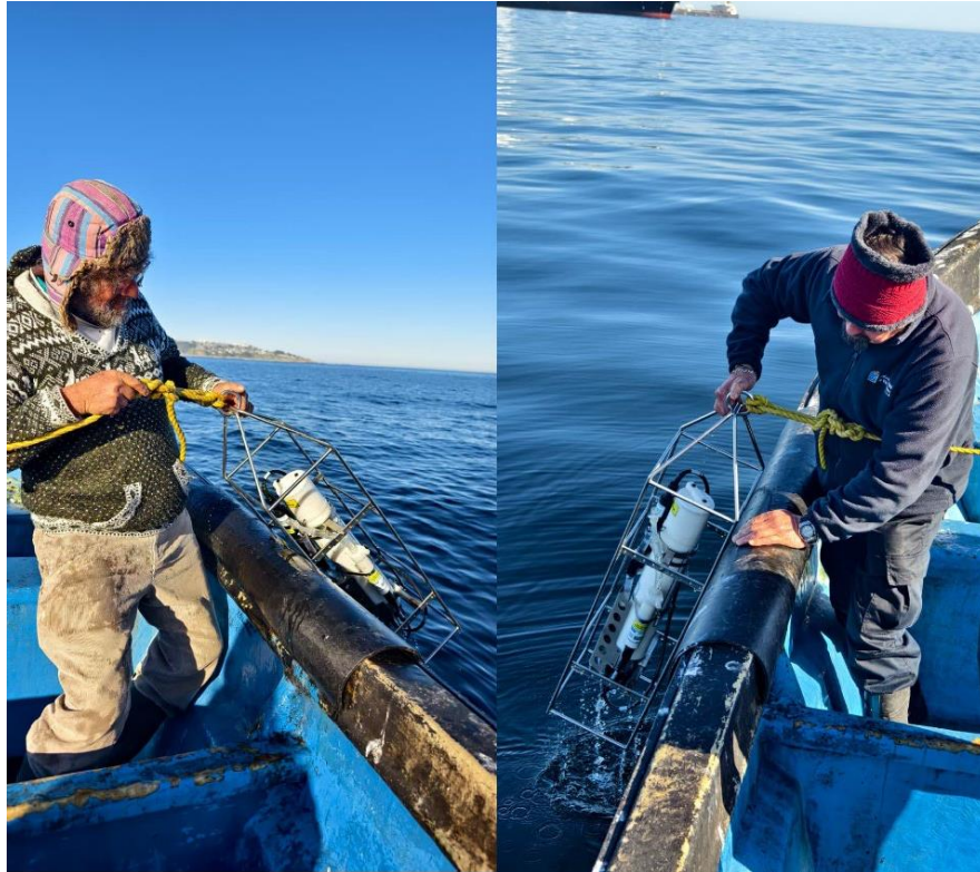
Figura 2 Despliegue de CTD en dos puntos de monitoreo con apoyo de integrantes de la Federación de Pescadores y la academia.

El procedimiento se efectuó desde una embarcación, mediante el descenso controlado de la sonda CTD a través de la columna de agua hasta el fondo. A medida que desciende, el equipo registra automáticamente los datos, que quedan almacenados en el dispositivo que no se puede alterar, para luego ser analizados por un laboratorio experto. Este mecanismo de registro asegura la trazabilidad de la información y permite la comparación de resultados entre campañas.