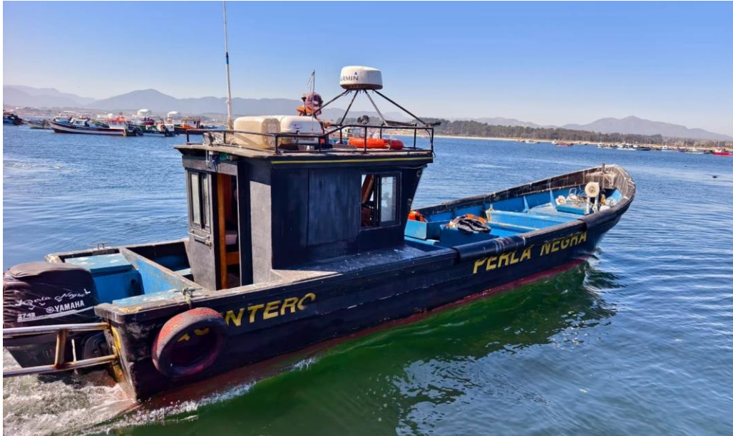
Figura 3 Embarcación profesional empleada para llevar a cabo la campaña CTD

Para la Campaña Invierno 2025 se utilizó un equipo CTD Seabird 19plus V2 SeaCAT (Figura 4), reconocido por su alta precisión y resolución. La ubicación de cada estación fue registrada mediante GPS para asegurar la repetibilidad del muestreo en campañas posteriores.